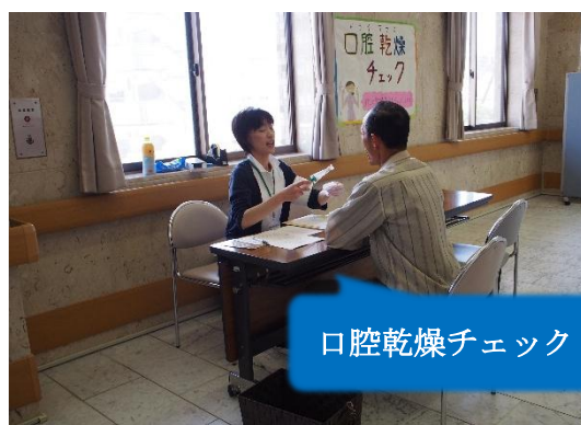
口腔乾燥チェック