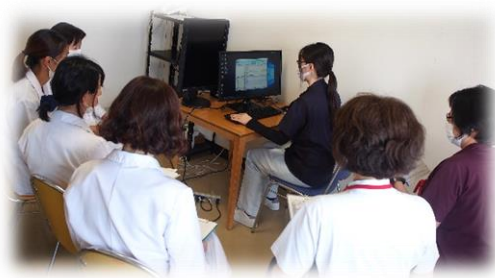
ラウンドの後、多職種で意見交換をします