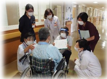
患者様に直接お話をうかがいます