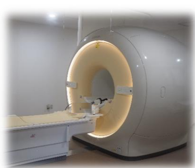
MRI(磁気共鳴画像診断装置) 令和 2 年 6 月より稼働した 最新式の機器です。